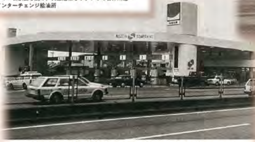
全天候型の屋根に覆われ、7つのゲートが並ぶ「サムシング一宮店」