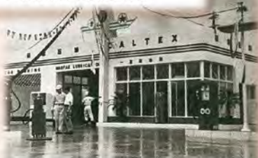
最新の設備とスマートな建物で新装オープンした一宮給油所