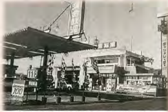
ドライブ相談室を設け、安全運転を呼びかけた名神高速一宮インターチェンジ給油所