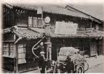
昭和初年代の大森石油店